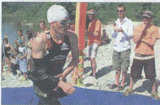
Les triathlètes du club d'Orange dans la course.

Deux sas de transition, séparant filles et garçons, avaient été mis en place pour la première fois. Inspiré des championnats de France, l'objectif était d'enchaîner