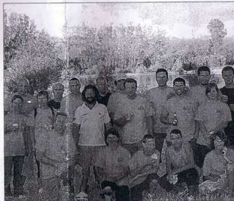
"Une épreuve bien organisée, avec un travail en coopération avec l'organisateur et des bénévoles agréables et efficaces".

Cinq équipes l'ont effectué en Relais, dont deux du Mistral Triath'Club. □